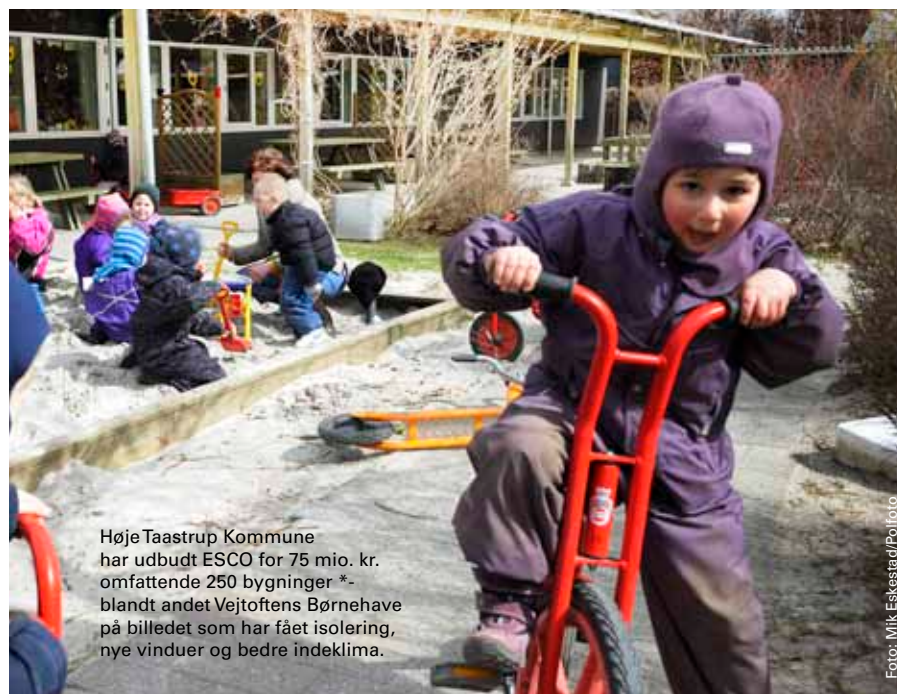
Høje Taastrup Kommune har udbudt ESCO for 75 mio. kr. omfattende 250 bygninger * - blandt andet Vejtoftens Børnehave på billedet som har fået isolering, nye vinduer og bedre indeklima.

ESCOmmuners formål er at fremme og udbrede brugen af ESCO-konceptet i Danmark og udruste danske kommuner til at kunne prioritere og bruge ESCO-kontrakter som et centralt energispareelement i kommunal bygningsdrift.